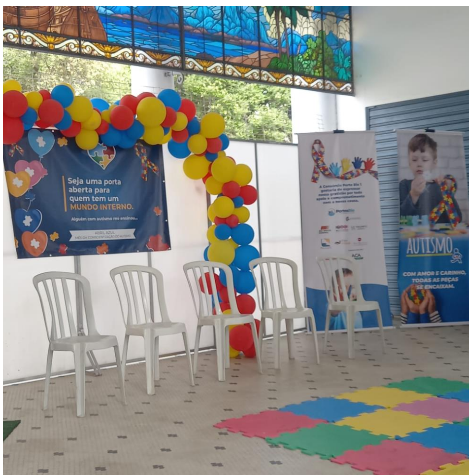
Espaço em que ocorreram as palestras

O evento aconteceu no Edifício Touring, anexo ao terminal de passageiros, e contou com a participação de colaboradores da comunidade portuária, seus familiares e também de moradores dos bairros vizinhos ao porto. O objetivo do encontro foi levar informação para o melhor entendimento do Transtorno do Espectro Autismo (TEA), contribuindo para promoção da inclusão e acolhimento dos indivíduos com TEA.