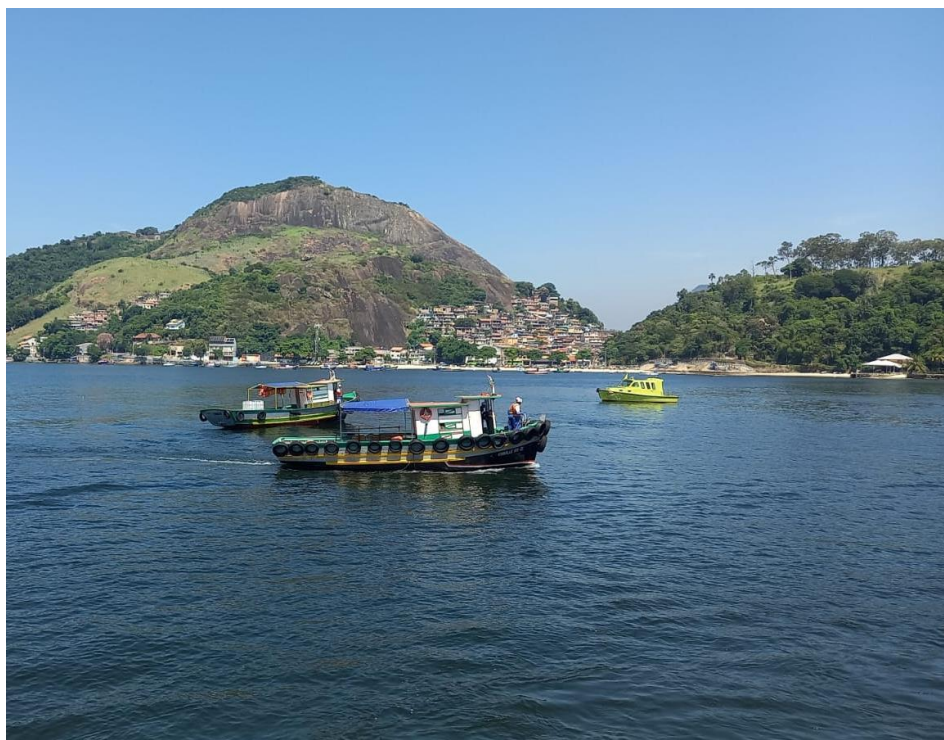
Simulado de primeiros socorros de homem ao mar