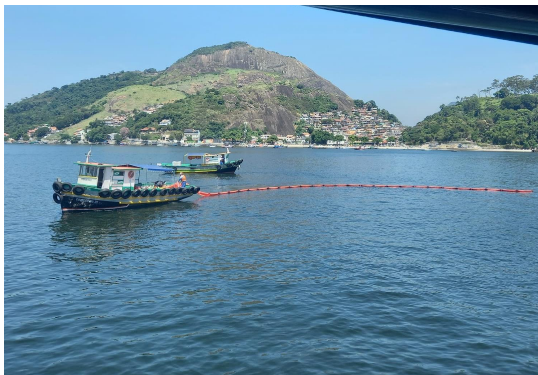
Simulado de vazamento de óleo e abalroamento