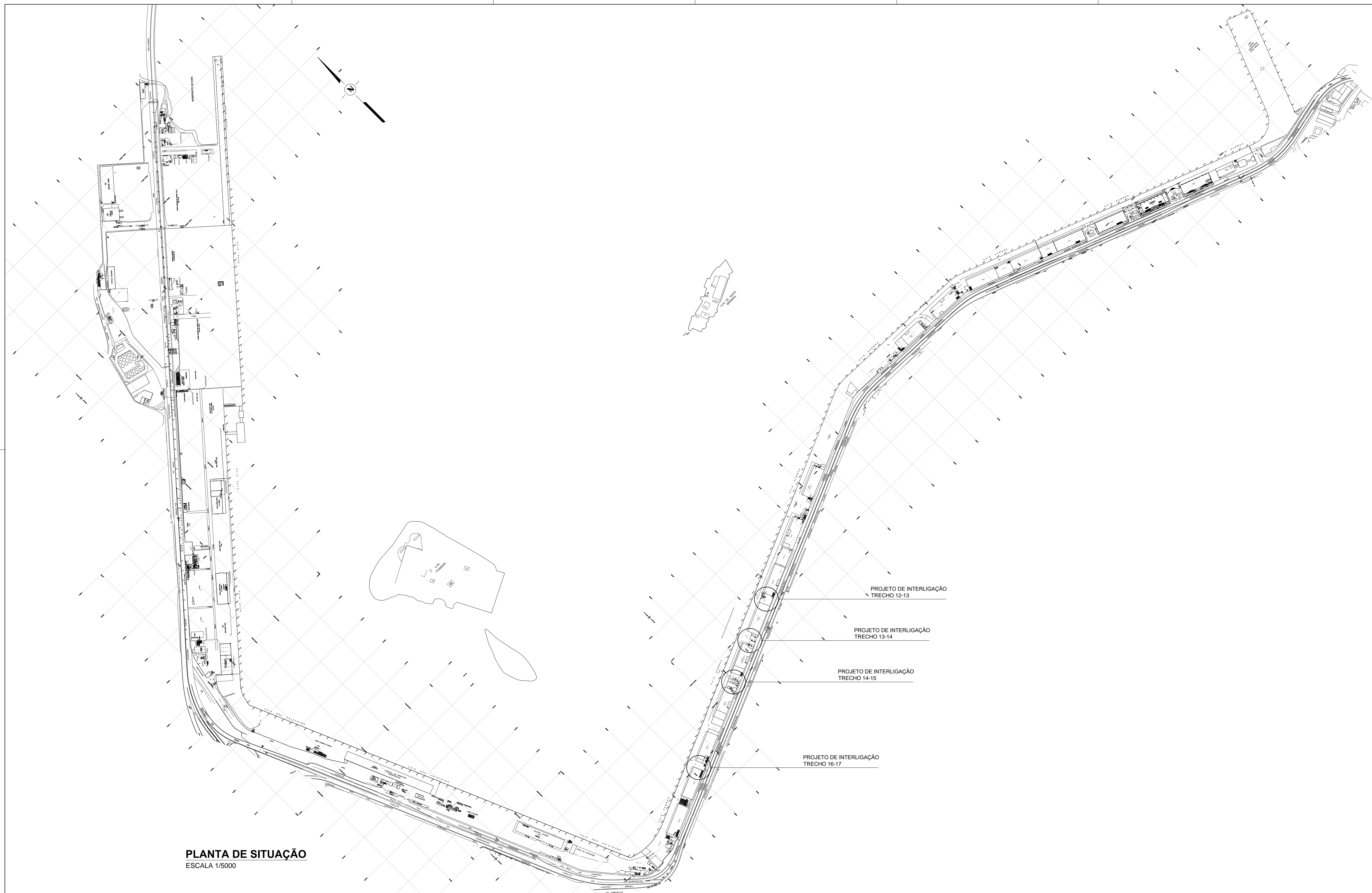
PLANTA DE SITUAÇÃO ESCALA 1/5000

T&M - Tostes e Medeiros Engenharia Ltda.